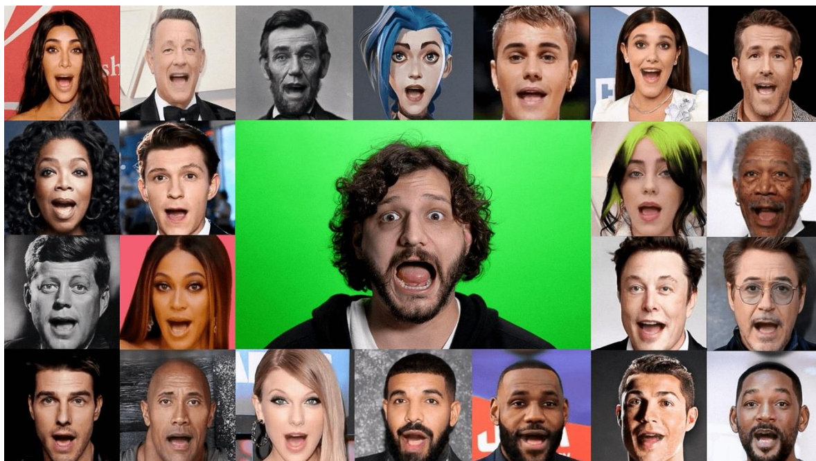
Εικ.1: Εικόνα από ProductionCrate, εφαρμογή facial motion capture ( https://www.productioncrate.com/archives/ae-plugins/Crates-Image-Motion-Installer )

Θα δημιουργηθεί ένα «ομιλούν ψηφιακό πορτρέτο» Artificial Intelligence το Κ. Κονοφάγου, το οποίο όταν πλησιάζει ο επισκέπτης θα ενεργοποιείται αφηγούμενο την ιστορία σε α' πρόσωπο, με την απαραίτητη δραματοποίηση. Το πορτραίτο θα δημιουργηθεί με την τεχνική του facial motion capture (προσαρμογή εικόνας προσώπου Κονοφάγου σε πραγματικό πρόσωπο) μέσω εφαρμογής (πχ After Effects, ProductionCrate κ.α.).